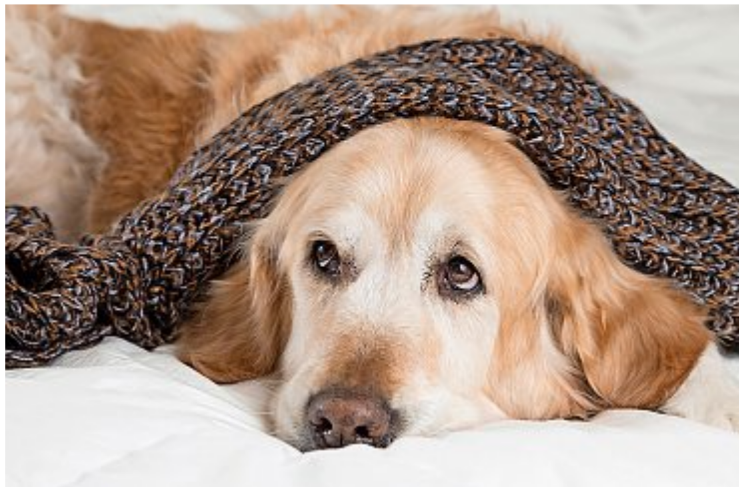
Ist der Hund sehr krank, sollte ein Veterinär das Tier einschläfern.